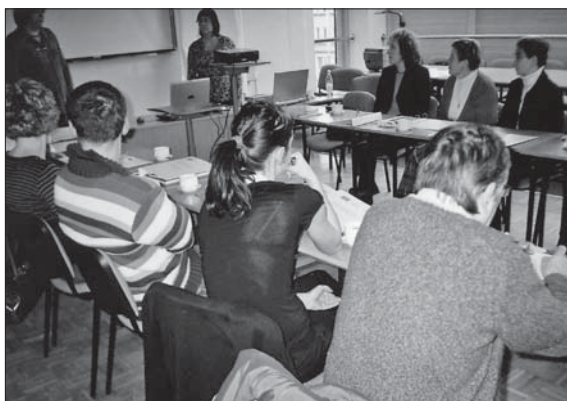
Sluchacze poznali dotychczas cele i społeczny kontekst ewaluacji (na zdjęciu migawka z tych zajęć) oraz metody i techniki socjologiczne.

w ramach ćwiczeń. Ich poziom, oceniony przez prowadzących, rzutuje na ocenę efektywności warsztatów. (ap)